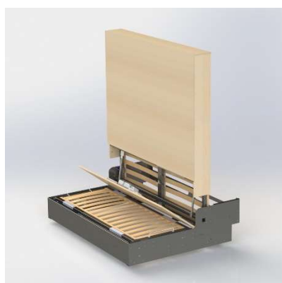
Largeur suivant couchage