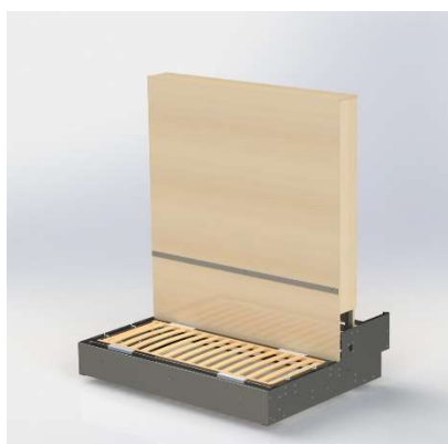
Fermé H 218 cm / P 147 cm*

Pour toute information et tarifs, contactez-nous au 07.78.51.12.00 ou par mail : contact@liftsecurity.net www.liftsecurity.net