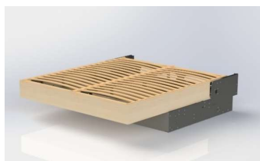
Ouvert H 48 cm / P 218 cm*