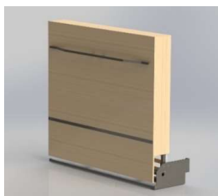
Fermé : H 204 cm / P 58 cm*

Pour toute information et tarifs, contactez-nous au 07.78.51.12.00 ou par mail : contact@liftsecurity.net www.liftsecurity.net