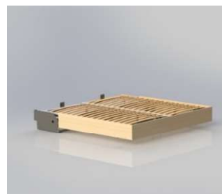
Ouvert : H 34 cm / P 214 cm*