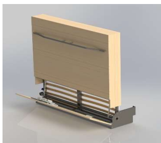
Largeur suivant couchage