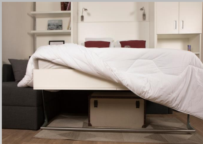
PIED AVEC BARRE INOX (en série)